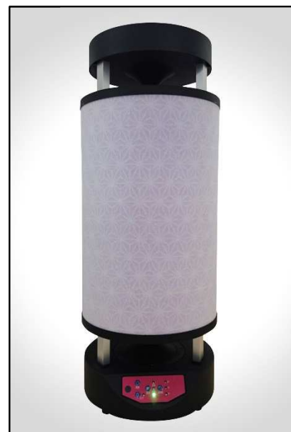
スタンダードバージョン (和紙柄タイプ)