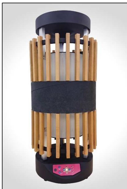
工芸品バージョン

「和のインテリア」に仕上げたオールシーズン仕様の扇風機 和 わ 風 ふう 機 き を新発売。